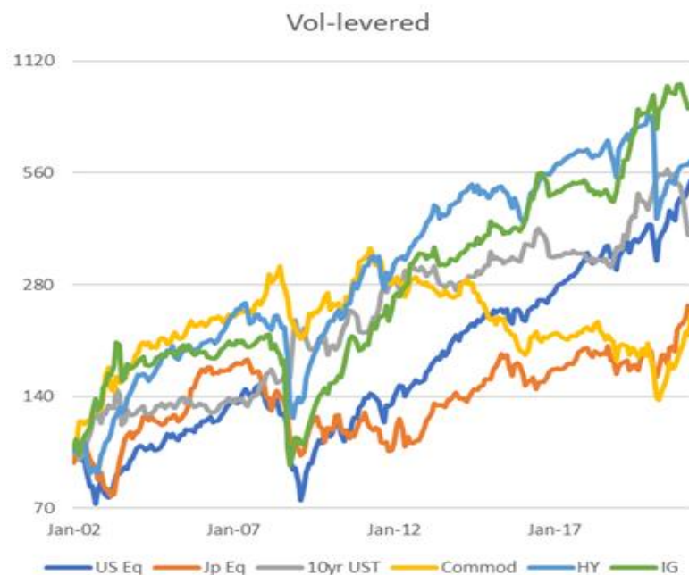
Abbildung 3: Gesamtrenditen, skaliert um die Volatilität der letzten 12 Monate, 2002–2021

Für die Erstellung von „risikogleichen“ Zeitreihen wird das Exposure marktübergreifend skaliert, sodass die Volatilität der verschiedenen Anlageklassen jeweils der impliziten 12-Monats-Volatilität des S&P 500 (SPX) entspricht; dieser Vorgang muss jeden Monat wiederholt werden.